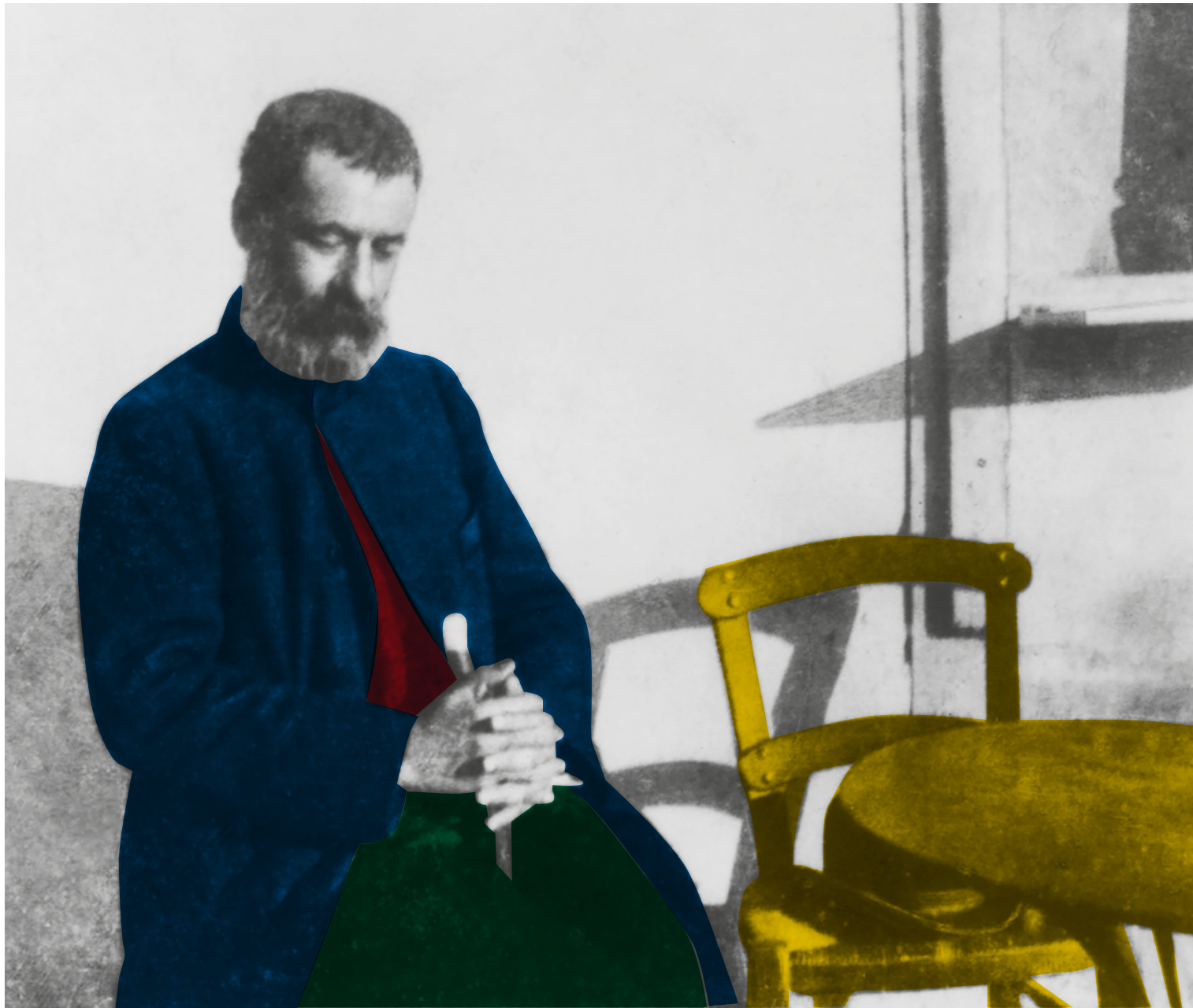
Ο ΠΑΠΑΔΙΑΜΑΝΤΗΣ ΦΟΤΟΓΡΑΦΗΜΕΝΟΣ ΑΠΟ ΤΟΝ ΠΑΥΛΟ ΝΙΡΒΑΝΑ ΣΤΗ ΛΕΞΑΝΙΝΗ ΤΗΣ ΑΘΗΝΑΣ ΤΟ 1906.

ΑΛΕΞΑΝΔΡΟΣ ΠΑΠΑΔΙΑΜΑΝΤΗΣ Ο Αυτοκτόνος Επιμέλεια: Λαμπρινή Τριανταφυλλοπούλου Έκδοση Εθνικής Βιβλιοθήκης της Ελλάδος Σελ.: 88