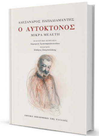
Η νέα έκδοση για τον «Αυτοκτόνο» κυκλοφόρησε σε έναν πληρέστατο τόμο.

Το συγκεκριμένο χωρίο περιγράφει τα βάσανα του Σακελλάριου με τη σπιτονοκοκυρά του. Είναι ένας από τους λόγους που τον κάνουν να κλέψει ένα ζυγάρι. Το διήγημα όμως δεν φθάνει έως την αυτοκτονία. «Πιστεύω, βάσει της λογικής και της ανάπτυξης του κειμένου, ότι ο ήρωας δεν αυτοκτόνησε», λέει στην «Κ» ο πρόεδρος του Εφορευτικού Συμβουλίου της ΕΒΕ, Σταύρος