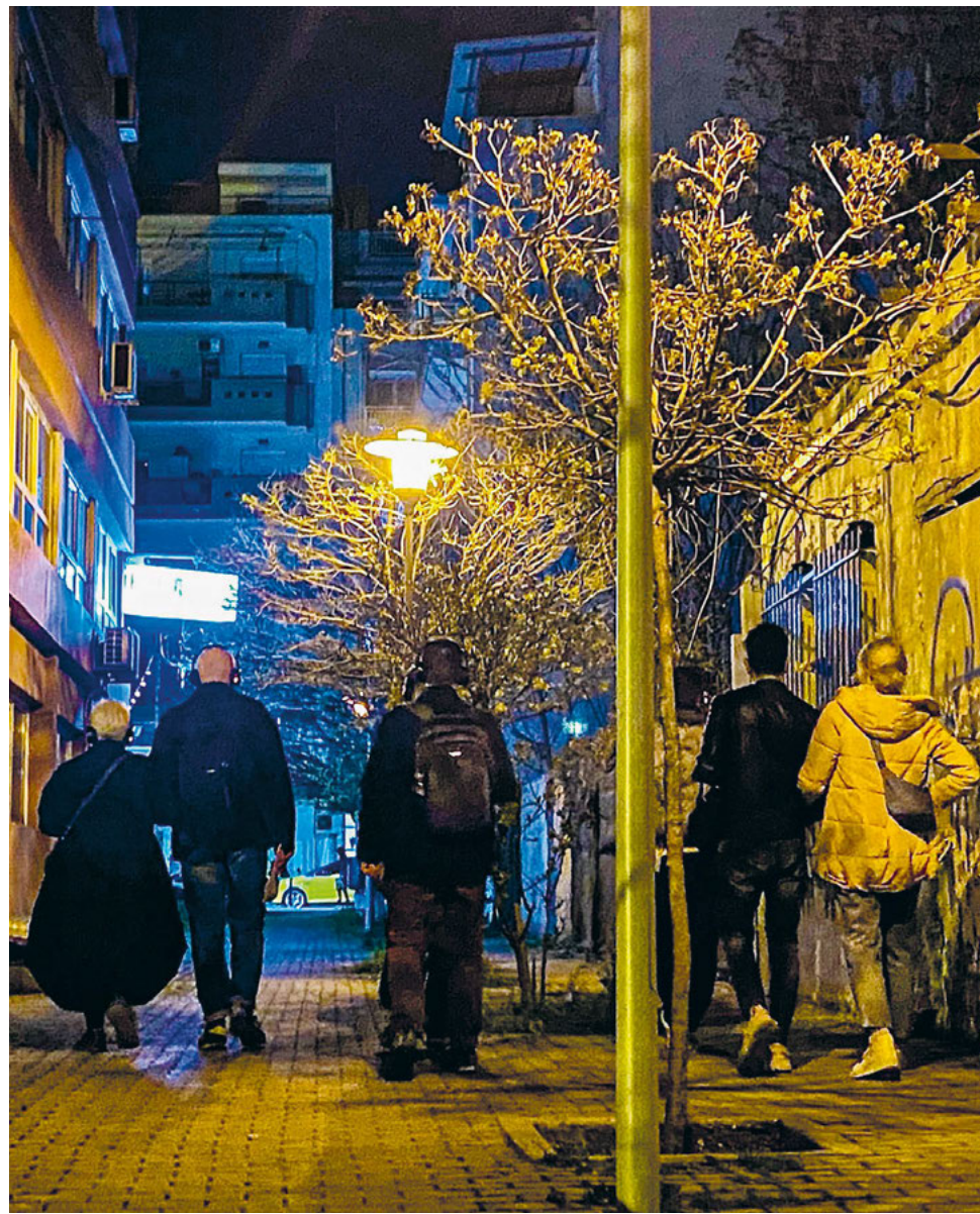
Η περιπατητική περιφόρμαν «Λίγο φαί για τον δρόμο» διοργανώνεται μόνο βραδινές ώρες.

Η βιωματική διαδρομή «Λίγο φαί για τον δρόμο», διάρκειας 125 λεπτών, κάνει πρεμιέρα στις 19 Απριλίου. Κάθε Παρασκευή, Σάββατο και Κυριακή. Διάρκεια έως 26 Μαΐου. Συμμετέχουν αουστρά 50 άτομα. Απαιτείται προκράτηση θέσεων.